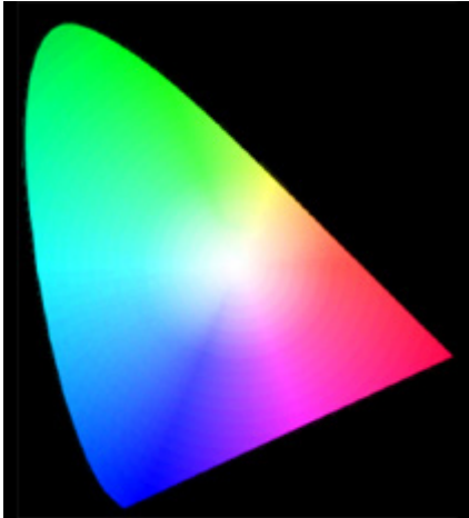
El Diagrama de cromaticidad CIE 1931: Todos los colores que el ojo humano es capaz de ver

Este diagrama, conocido como el diagrama de cromaticidad CIE 1931 , representa todos los colores que el ojo humano es capaz de ver.