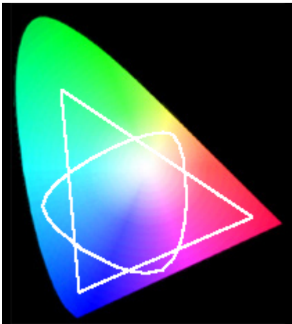
El gamut genérico de un monitor RGB comparado con el gamut genérico de un dispositivo de impresión CMYK.

El gamut de color de un dispositivo de impresión es distinto del de un monitor, aunque ambos sean subconjuntos de un mismo diagrama de cromaticidad (es decir de los colores visibles para el ojo humano). El gamut de un aparato de impresión suele ser más limitado que el de un monitor. Dicho de otro modo: Una impresora sólo puede reproducir una parte del gamut de un monitor. Dependiendo de las combinaciones impresora/monitor, habrá algunos casos de colores que se pueden imprimir pero que un monitor no podrá reproducir.